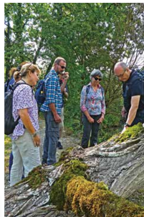
^ Mit dem Exkursionsleiter den Naturpark entdecken

Doch allein das Wissen verändert noch nichts. Umweltbildung muss umsetzungsorientiert sein. So beschäftigten sich Schülerinnen und Schüler aus Hallau während einer Projektwoche mit der regionalen Natur und bastelten Nisthilfen für Wildbienen. Andere Naturparkschulen leisten alljährliche Arbeitseinsätze im Wald. Damit lernen sie die Region besser kennen und gestalten die Zukunft aktiv mit.