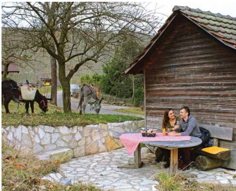
↖ Picknick mit Esel – ein besonderes Freizeiterlebnis im Klettgau. Mehr Infos: www.picknick-mit-esel.ch

Interessiert? Projektideen und Unterstützungsanträge können bei der Geschäftsstelle eingereicht werden.