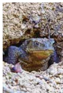
^ Erdkröte im Tagesversteck

Aktivitäten des Regionalen Naturparks Schaffhausen und seiner Partner seit der Gründung 2014: