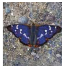
^ Kleiner Schillerfalter